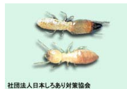
社団法人日本しろあり対策協会