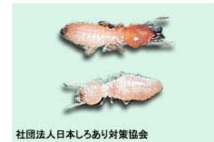
社団法人日本しろあり対策協会